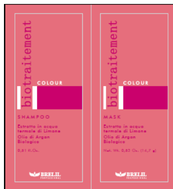
B064059 COLOUR SH+MASK 15ML+15ML