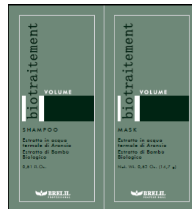
B064055 VOLUME SH+MASK 15ML+15ML