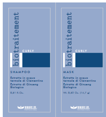
B064058 CURLY SH+MASK 15ML+15ML