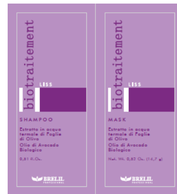
B064057 LISS SH+MASK 15ML+15ML