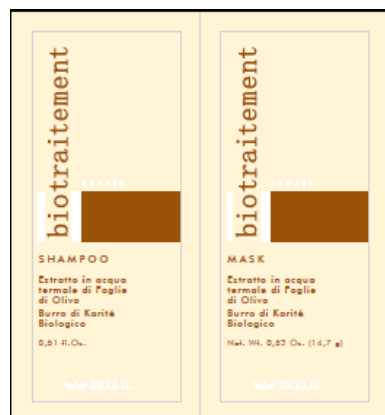
B064056 REPAIR SH+MASK 15ML+15ML